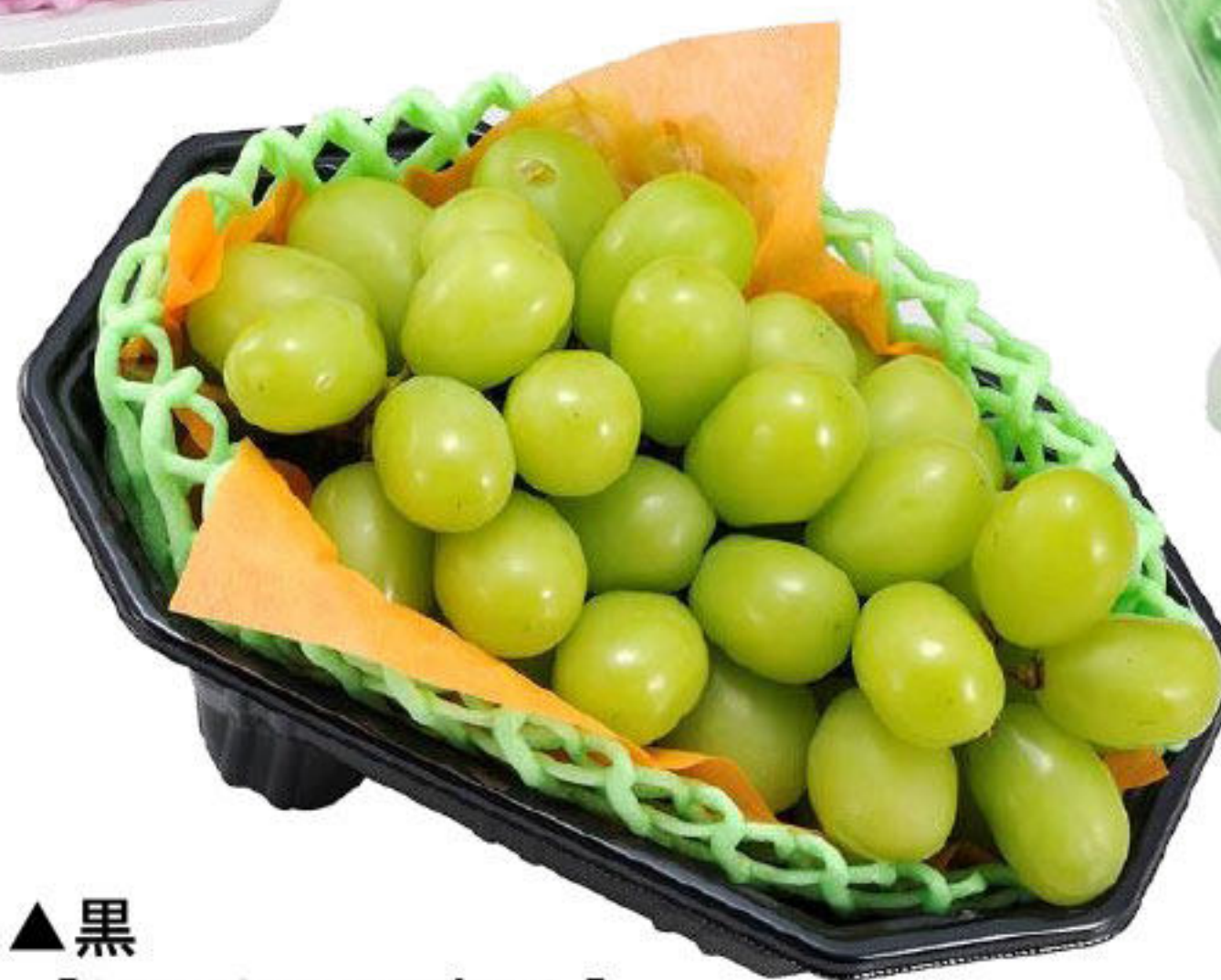
▲黒 [シャインマスカット]